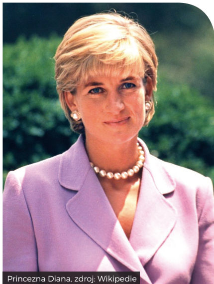
Princezna Diana

V 80. letech a na počátku 90. let bylo HIV často vnímáno jako „smrtelná nemoc těch druhých“. Veřejný prostor zaplavovaly dezinformace, nemocní čelili izolaci, ztrátě zaměstnání i odmítnutí ze strany rodiny či zdravotníků. Dotknout se člověka s HIV bylo pro mnohé nepředstavitelné. Právě do této atmosféry vstoupila Diana, princezna z Walesu, která se rozhodla dát lidskou tvář těm, o nichž se do té doby mluvilo jen šepem – nebo vůbec.